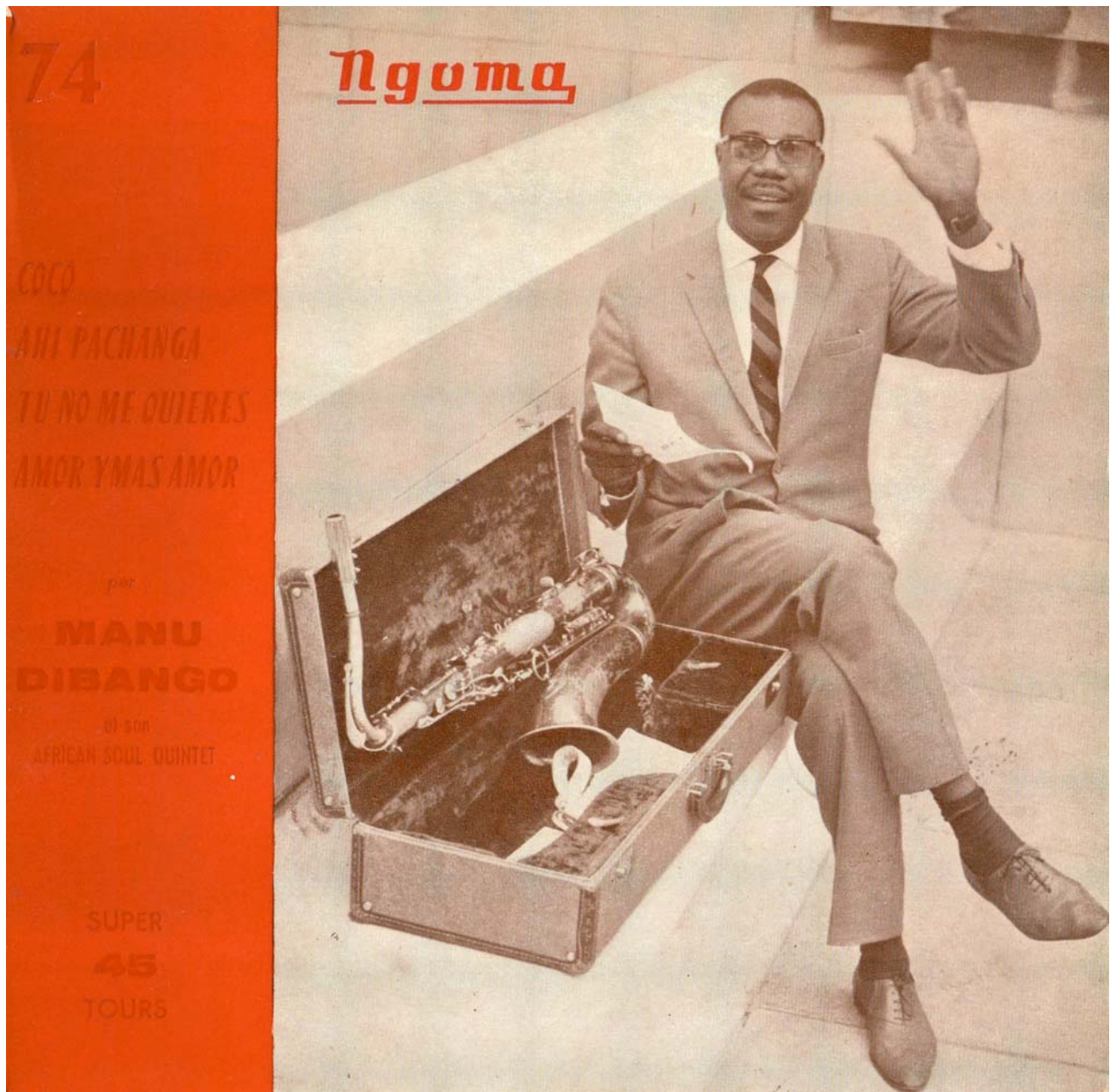
Manu Dibango & African Soul Quintet – 1964- Disque Ngoma